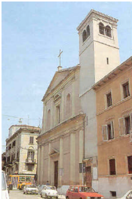
Igreja de São Paulo em Verona

Gaspar viu nas palavras do pároco o convite de Deus e não mais hesitou: no dia 3 de novembro de 1795 começou a freqüentar, como aluno externo, o curso de Teologia no seminário.