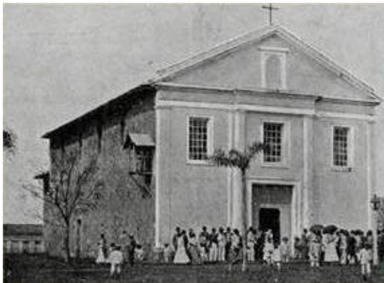
Igreja de Tibagi