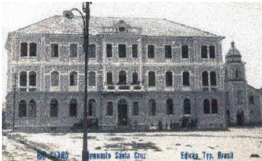
Rio Claro – Ginásio Santa Cruz

No dia 03 de setembro o colégio foi coberto. Completavam-se os últimos acabamentos.