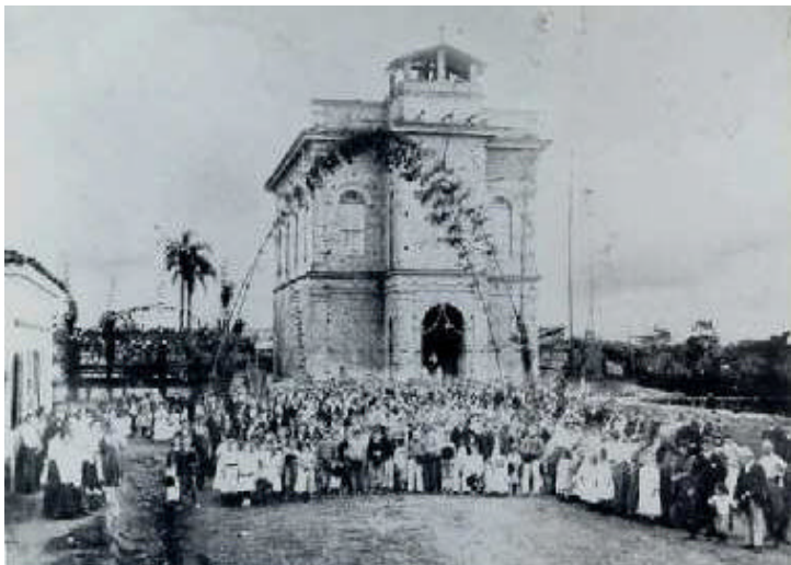
Matriz antiga de São Caetano

Conta aproximadamente com 07 mil habitantes, mas está predestinada a um desenvolvimento rápido de população, atraída pelas grandes fábricas em funcionamento e em construção. Os habitantes, são, na grande maioria, italianos ou filhos de italianos, de modo especial, vênnetos. Alguns fizeram fortuna regular, especialmente com a venda de terrenos, que compraram por uma ninharia quando chegaram ao Brasil (mais ou menos há uns quarenta anos) e agora