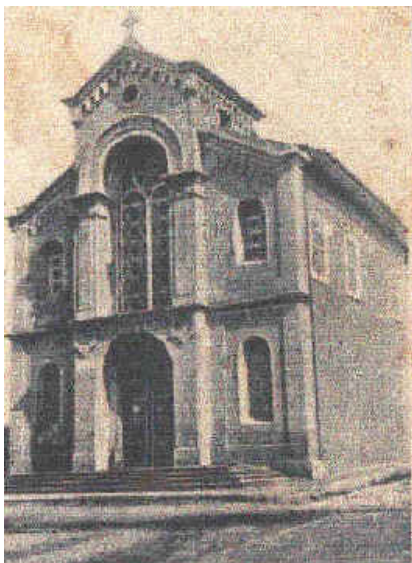
São Benedito - Campinas

É cidade culta, merecendo o título de "Atenas Paulista", pelo grande número de institutos de educação e instrução que possui.