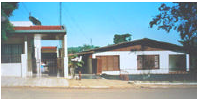
Pré-seminário Santa Cruz