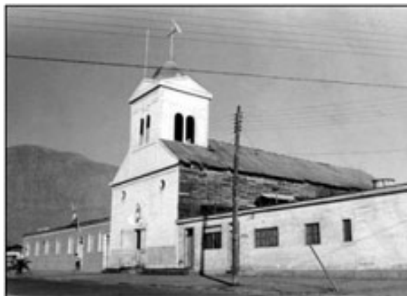
Parroquia N. Sra. do Perpétuo Socorro