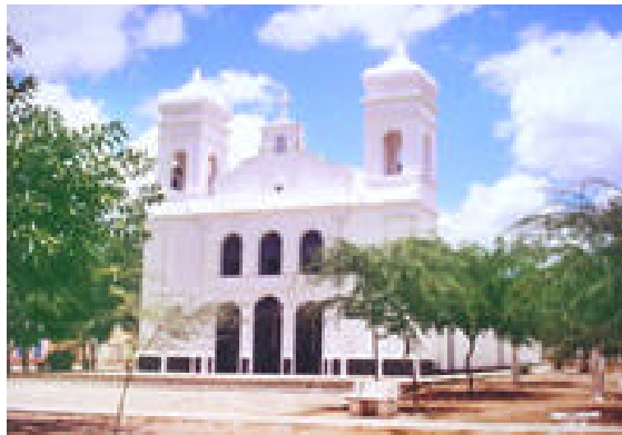
Par. N. Sra. do Alívio