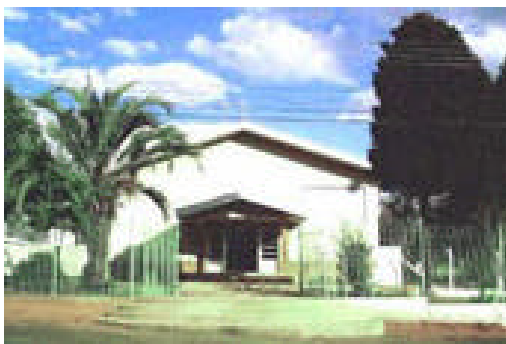
Par. Divino Espírito Santo