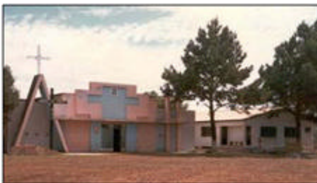
Matriz de Palmas

Palmas é uma cidade antiga, das mais antigas do Paraná, fundada em 1840.