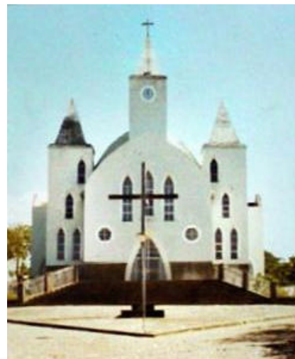
Paróquia Senhor do Bonfim

Joaíma é uma cidade construída no topo do morro, possui 8 mil habitantes e os 14 mil restantes são da zona rural. Ao todo, 22 mil no município com seus 2.165 kms 2 . Fica distante de Almenara 72 kms. Joaíma é uma cidade limpa e totalmente calçada com pedras pé de moleque como se costuma dizer. A cidade leva o nome de Joaíma devido ao chefe índio botocudo que se chamava Joaíma e sua tribo aqui se radicou por muito tempo. O padroeiro é o Senhor do Bonfim.