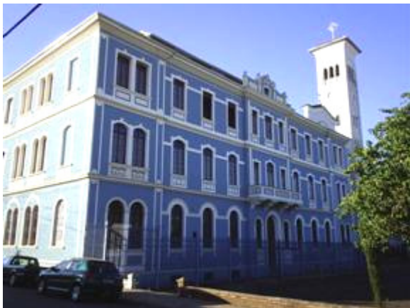
Nova Cúria Provincial