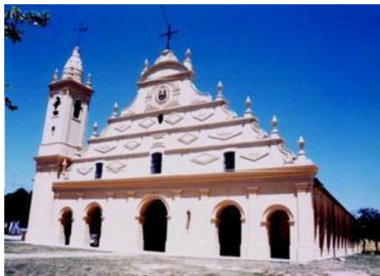
Parroquia Santísima Trinidad