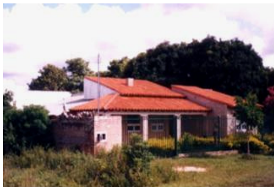
Seminario Arami Rendá

Presentes no Paraguai desde 1995, os padres estigmatinos, somos responsáveis pela Paróquia Virgem do Rosário e atendemos nela 42 comunidades: 12 na cidade e 30 na zona rural e animamos todas as pastorais nelas existentes. Fruto desse trabalho surgiram vocações que eram enviadas para estudar no Chile, por falta de uma estrutura que lhes possibilitasse a formação no próprio país.