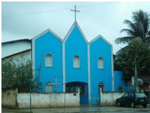
Paróquia Sagrado Coração de Jesus

ILHÉUS - "Depois de um longo processo de discernimento, no dia 22 de fevereiro, finalmente e oficialmente, nossa Província estará estendendo sua presença na região da Bahia. Neste dia na cidade de Ilhéus-BA, estaremos assumindo a Paróquia Sagrado Coração de Jesus, no Bairro Iguape.